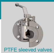
PTFE sleeved valves